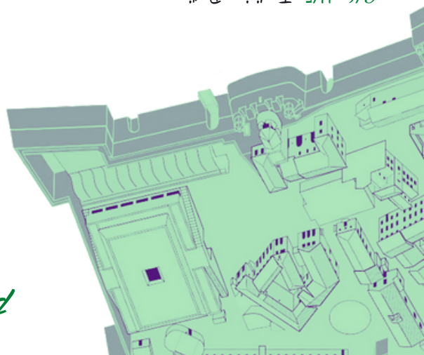
Padiglione Spadolini Food